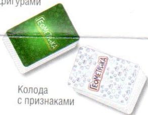
Колода с признаками