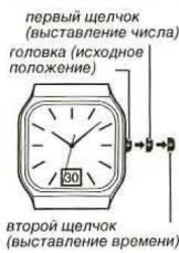
первый щелчок (выставление числа) головка (исходное положение)