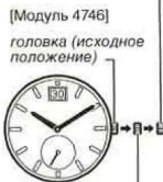
[Модуль 4746] головка (исходное положение)