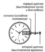
первый щелчок (выставление числа и дня недели)