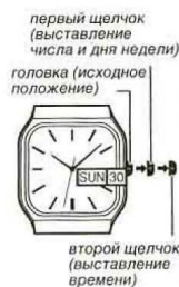
первый щелчок (выставление числа и дня недели)