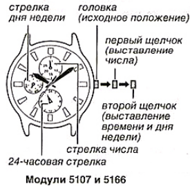
Модули 5107 и 5166