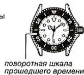
поворотная шкала прошедшего времени