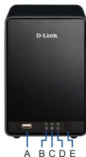
Рис. 1. Передняя панель DNR-326