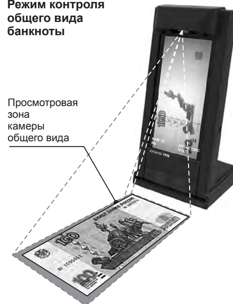
Рис. 2 Режим контроля общего вида банкноты