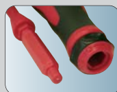
надёжное удержание стержней в ручке – шестигранное гнездо