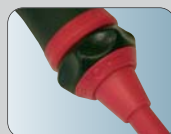
автоматическая блокировка от случайного вынимания