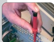
вставной поворотный колпачок позволяет использование в качестве инструмента для тонких работ