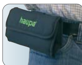
прочная нейлоновая сумка с петлей для ремня, застёжкой-липучкой и петлей для подвешивания