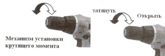
Механизм установки крутящего момента