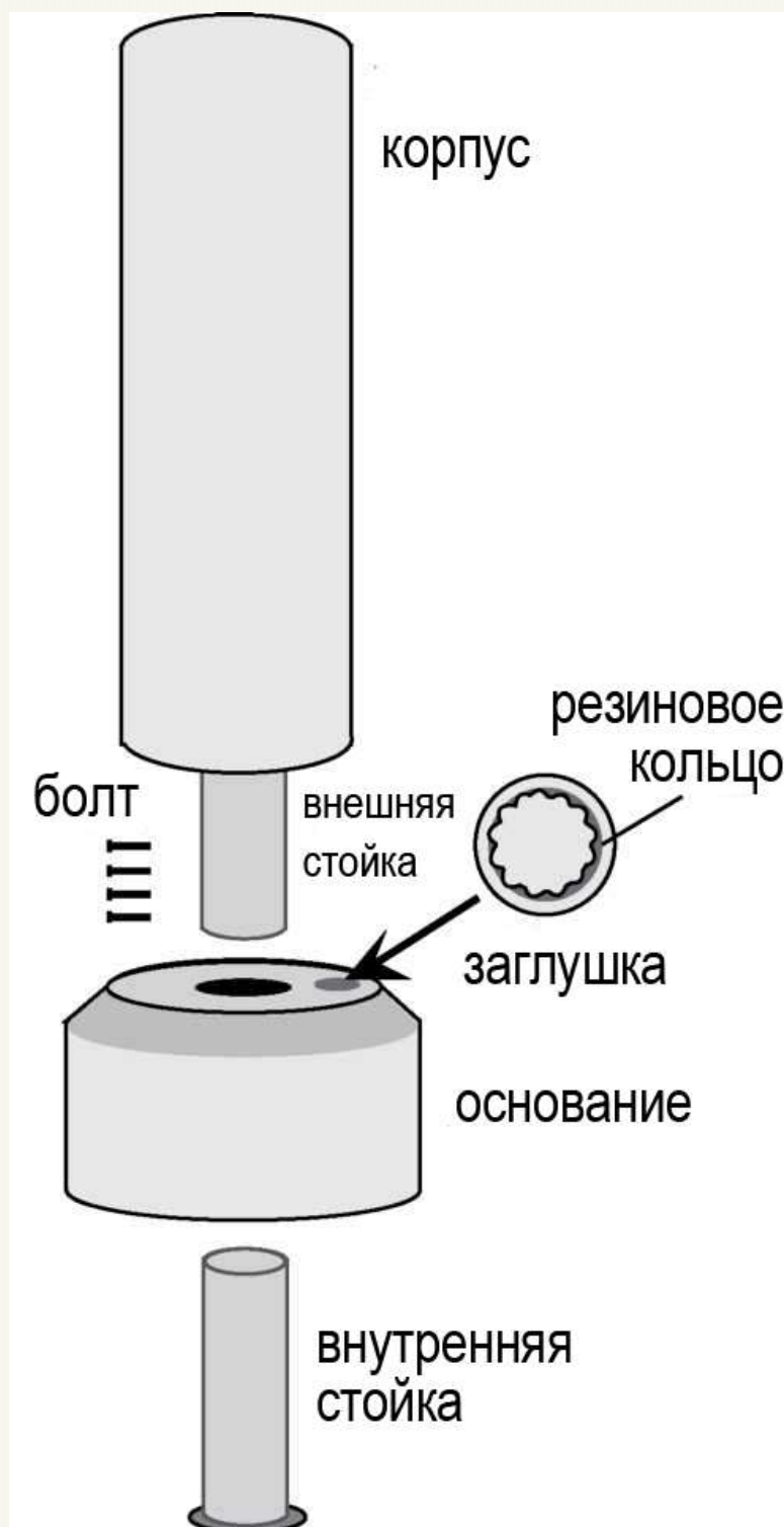
ДИАГРАММА СОСТАВНЫХ ЧАСТЕЙ