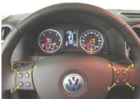
Фото 1. Руль с круглыми клавишами

Данный модуль может применяться на следующих а/м с информационным дисплеем на приборной панели белого свечения, оборудованных круглыми (Фото 1) или прямоугольными (Фото 2) клавишами на руле: VW Passat B6, VW Passat CC, VW Jetta, VW Touran, VW Golf VI, VW Golf VI+, VW Tiguan, VW Eos, VW Caddy