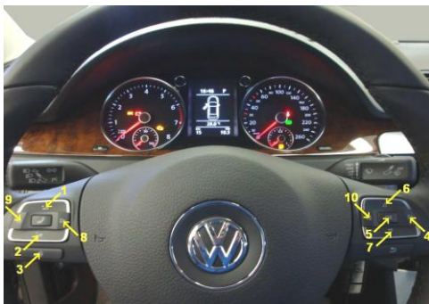
Фото 2. Руль с прямоугольными клавишами