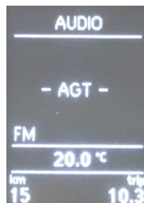
Фото 3. Отображение на дисплее режима AUDIO

* Данные функции клавиш работают только в режиме выбранного клавишами 4, 10 пункта меню AUDIO (Фото 3).