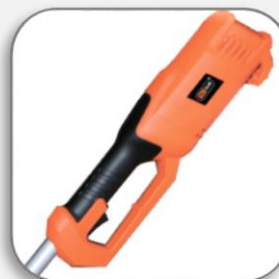
Противоскользящее покрытие рукоятки