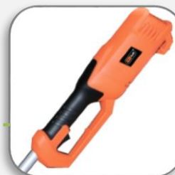
противоскользящее покрытие рукоятки

плечевой ремень облегчает работу оператора