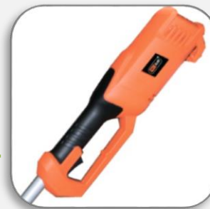
противоскользящее покрытие рукоятки