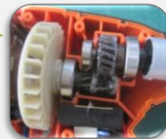
металлические шестеренки редуктора

плечевой ремень облегчает работу оператора