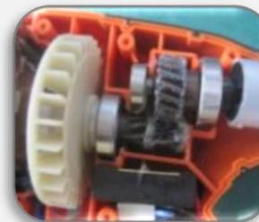
металлические шестеренки редуктора