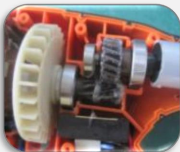
металлические шестеренки редуктора