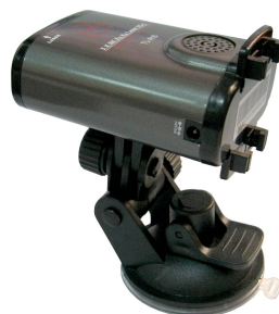
Рисунок 1. Крепление на кронштейне