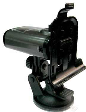
Рисунок 2. Крепление рамки для навигатора